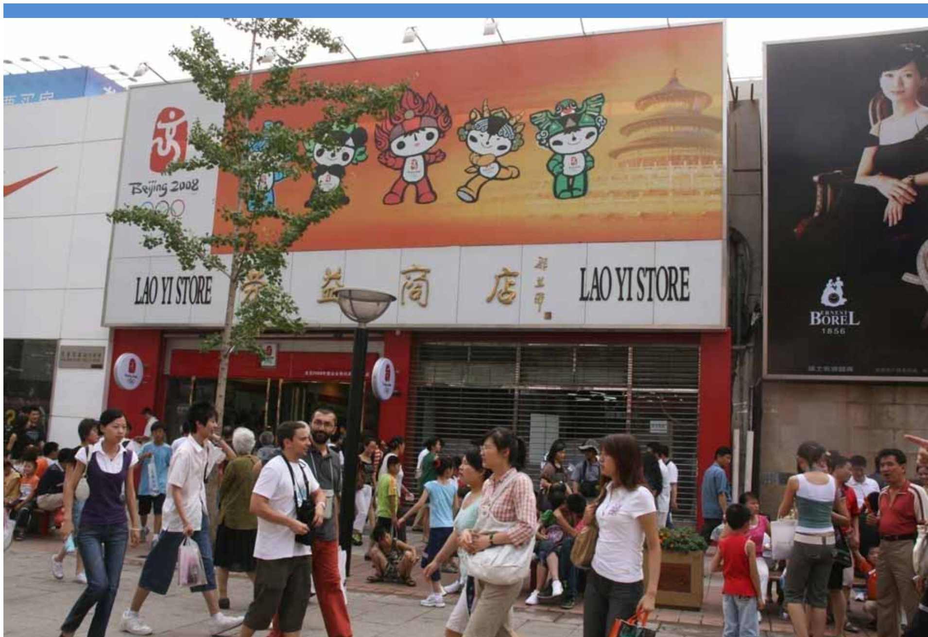
En officiel OL-butik i Beijing, hvor man kan købe OL-souvenirs. En OL t-shirt koster ca. 90 kroner. Mange kinesere må leve for ca. 12 kroner om dagen!